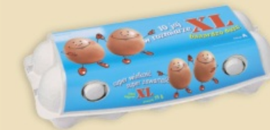
imagic® MAX E9410 - na 1 x 10 jaj XL