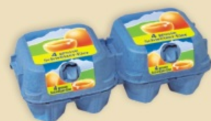
Mini Poster Pack™ E6608 - na 2 x 4 jaja

Dostępne w wersji z nadrukiem bezpośrednim jako Plus Pack™ , lub z wysokiej jakości etykietą jako Mini Poster Pack™ , w 7 różnych rozmiarach. Pozwolą zapakować najpowszechniej kupowane liczby jaj. Sprostają wymaganiom konsumentów i skutecznie sprzedadzą gotowy produkt w segmencie cen średnich i niższych.