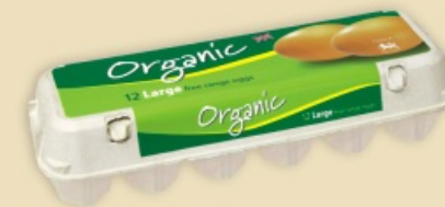
Mini Poster Pack™ E5412 - na 1 x 12 jaj