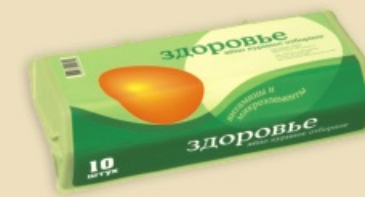
Superface® E7210 - na 1 x 10 jaj