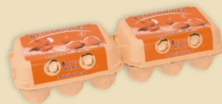
Mini Poster Pack™ E5312 - na 2 x 6 jaj