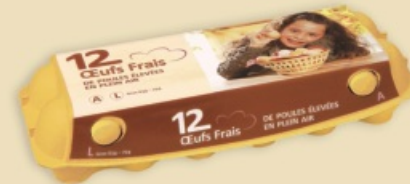
imagic® E9212 - na 1 x 12 jaj