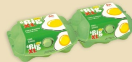
imagic® MAX E9312 - na 2 x 6 jaj XL