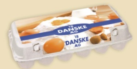
Mini Poster Pack™ E3918 - na 1 x 18 jaj