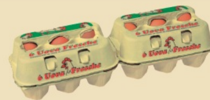
Fresh Pack™ E4912 - na 2 x 6 jaj

Opakowania z otworami, dostępne w 2 rozmiarach. Przeznaczone do sprzedaży jaj w segmencie cen niższych. W punkcie sprzedaży generują sugestywny i czytelny komunikat do konsumenta jaj - świeże jaja za rozsądną cenę.