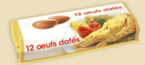
Superface® E7312 - na 1 x 12 jaj