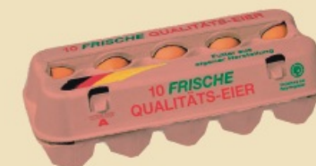
Fresh Pack™ E3810 - na 1 x 10 jaj