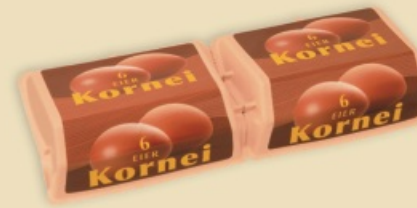
Superface® E7412 - na 2 x 6 jaj