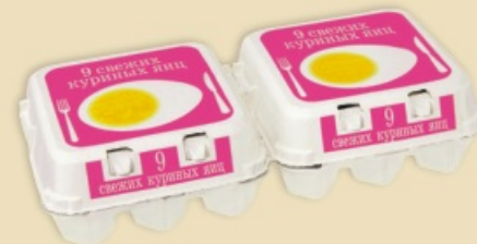
Plus Pack™ E7918 - na 2 x 9 jaj