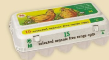
Plus Pack™ E5915 - na 1 x 15 jaj