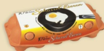
imagic® E9910 - na 1 x 10 jaj