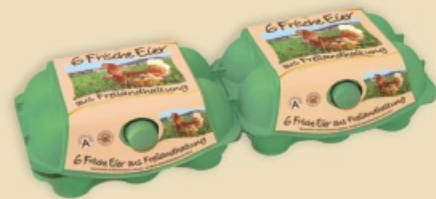
imagic® E9812 - na 2 x 6 jaj

Bardzo dużym jajom w rozmiarze XL dedykowane są kolorowe opakowania imagic® MAX . Dostępne w 2 rozmiarach. Profesjonalnie zaprojektowana etykieta efektywnie i skutecznie sprzedaje gotowy produkt na wymagającym rynku.