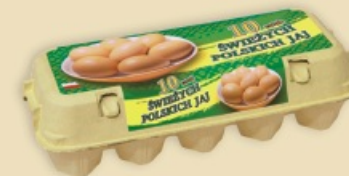
Mini Poster Pack™ E3310 - na 1 x 10 jaj