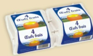
Superface® E7108 - na 2 x 4 jaja

Dostępne w 4 rozmiarach, 8 kolorach, z wysokiej jakości etykietami. Opakowania PREMIUM z imponująco dużą powierzchnią reklamową etykiety - idealne do sprzedaży jaj markowych - o ugruntowanej silnej pozycji - oraz jaj delikatesowych. Dzięki potencjałowi reklamowo-komunikacyjnemu bardzo dużej etykiety, opakowanie skutecznie i szybko wywołuje impuls zakupowy.